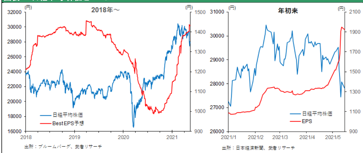
図表 4: 日経平均 株価と EPS